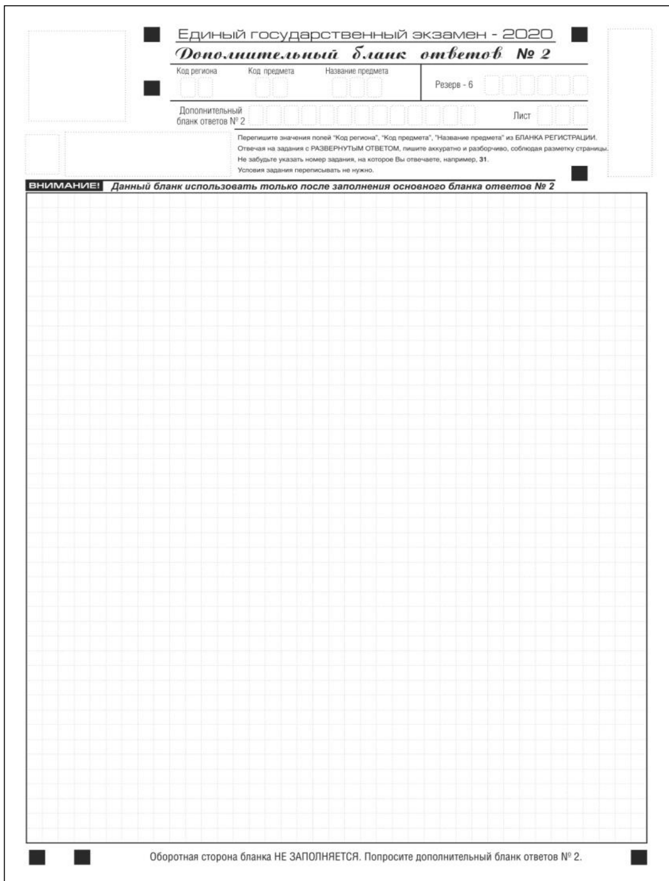
Рис. 15. Дополнительный бланк ответов № 2